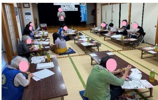
ソーシャルディスタンスを確保 (8月17日 船橋地区会館にて)

今年の夏も、地域の皆様との交流を兼ねた、お針仕事のボランティア活動を行いました。