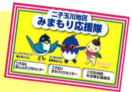
みまもり応援隊シール

「はじめの一步」 初めての方でも、生活の中 でゆるやかな見守りができ るよう分かりやすくポイント をまとめています。