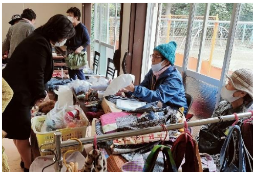
たくさん作品が並んでいます。

フリーマーケット会場では、出品者と購入者との間で活発な会話が飛び交っていました。参加者からは「皆と会えて嬉しかった」「元気が出た」「モヤモヤしていたものが吹き飛んだ感じがした」とのお声がありました。また、当日は大蔵調剤薬局・メモリード東京による個別相談会も行われました。今後も、新型コロナ感染症対策を十分に講じながら、ひまわり喫茶を支援していきます。