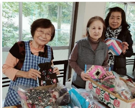
出品された住民の皆さま