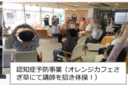
認知症予防事業(オレンジカフェさ ぎ草にて講師を招き体操!)