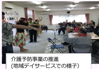
介護予防事業の推進 (地域サービスでの様子)

奥沢あんしんすこやかセンターは地域の方々が生み慣れた地域で健康に安心した生活ができるように様々な取り組みを行っております。また介護保険や介護予防だけでなく、生活に関するお困りごとをワンストップで関係機関へ繋ぐ役割などもさせていただき、奥沢地区の総合相談窓口です。