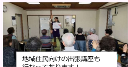
地域住民向けの出張講座も 行なっております!

当センターは3月23日(月)より移転し、奥沢まちづくりセンター、社会福祉協議会とともに新庁舎で運営を行なってまいります。(喫茶さぎ草はデイホーム奥沢内に今後継続して開催されます。)今まで以上に、密に迅速に連携を図ることで、奥沢地区の皆様が安心して相談ができる総合相談窓口を目指してまいります。 TEL:03-6421-9131 担当:篠崎・小山・松下