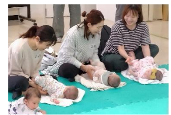
昨年度のベビーマッサージの様子

日時：2026年4月24日（金） 10：00～12：00 内容：ベビーマッサージ体験会 講師：MIE 先生 わらべうた 10分程度＋ベビーマッサージ 30分程度 場所：砧まちづくりセンター活動フロア（世田谷区砧5-8-18） 対象：2か月（検診後）～1歳未満の赤ちゃんとお母さん 持ち物：大きめのバスタオル、飲み物、動きやすい恰好 お申込み：以下のURLより、氏名・お子さんの年齢（月齢）・住所・電話番号・メールアドレスを明記しお申し込みください。お電話でのお申込みも可能です（お電話は下記まで）。