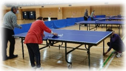
＜希望丘地域体育館で卓球台準備＞