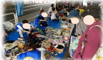
＜「ノミの市(フリマ)」の販売＞