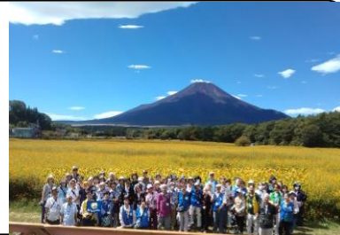
【高齢者交流会・R6年9月】

社会福祉協議会は、地域住民が主体となって、子どもから高齢者まで孤立せず安心して暮らせる船橋地区を目指し、活動しています。ぜひ、地区の事業にご参加いただくとともに、ご理解・ご支援をよろしくお願いいたします。