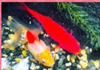
どんな模様に 育つかはお楽しみ。