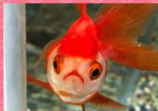
エサをねだる 仕草もかわいい♡