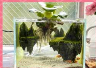
水槽アートを 楽しむのもよし。