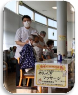
やわらぎマッサージ