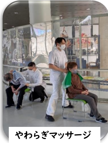
やわらぎマッサージ