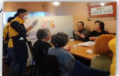
みんなで食べると楽しいネ