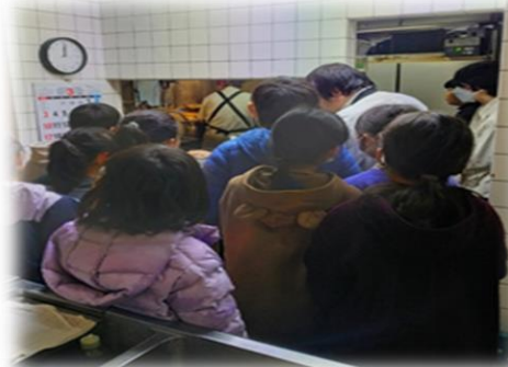
チャーハンの作り方を見学

プロのチャーハン作りを見学し、出来立てのチャーハンをみんなにいただき、お腹いっぱい、心もいっぱいで、笑顔での食事会となりました。