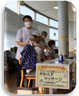
やわらぎマッサージ