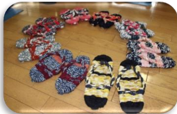
裂き布ぞうり作り

「なごみの広場ちとふな」は、高齢者の新たな居場所づくり事業です。健康運動室と視聴覚コーナーを会場に、暮らしに役立つ講座や趣味の講座を開催しています。ぜひご参加ください！