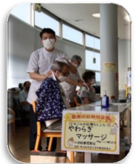
やわらぎマッサージ