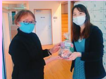
福音寮へお届けしました！