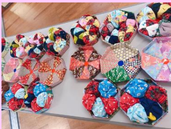
想いを込めて・・・♪

地域サービスせたすぎHR様より、“地域の子どもたちへ”と、素敵な折り紙の箱に入った手作りのお手玉をいただきました♪お手玉の中には、なんと！災害時に非常食にもなる小豆等が使われていました！いただいたお手玉は、上北沢児童館をはじめ、社会福祉法人福音寮や希望丘青少年交流センターアップスへお届けいたしました。地域サービスせたすぎHR様、ありがとうございました。