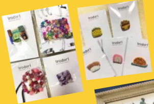
玉川福祉作業所 ☆irodori☆ By emi