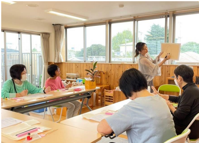
座学もしっかり受けました。

10月17日 ネイルマニキュア カラーリング 講座 ご参加ありがとうございました