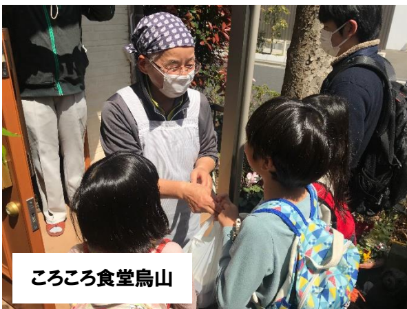
ころころ食堂烏山