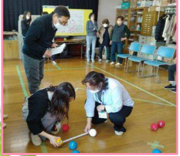
第3回「ポッチャを楽しもう」

まちづくりセンター、あんしんすこやかセンター、喜多見児童館、社会福祉協議会が協力し、さまざまな内容の企画を立て、毎月1回の交流をしています。参加者の数も、笑顔も、回を重ねるごとに増えていると感じます。