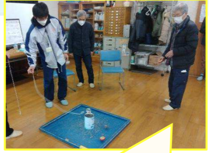
第1回「正月遊びをしよう」

喜多見2丁目団地では、自治会役員が中心となり「だんだんの会」と、いう集いを開催しています。この会は“自宅で過ごす時間が多くなりがちな高齢の方々が生活エリアで集まり、顔見知りが増えたら良いな”という団地の方々の思いが出发点で実現しました。