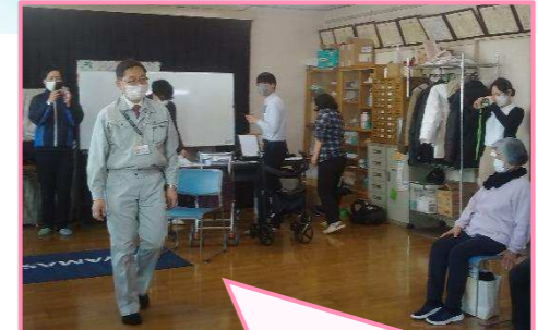
第2回「自分の歩き方を見よう~AIで解析~」