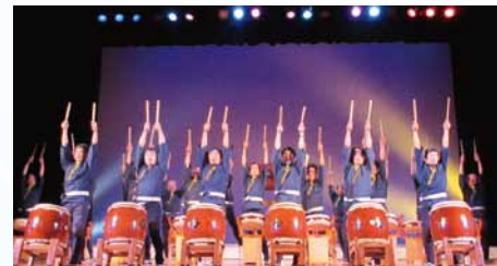
山崎メンズクラブ (和太鼓) 時間 / 13:20~13:35

ダンスラボラトリーは世田谷区と川崎市で「障害があってもなくても皆で楽しくダンス」を合言葉に活動しています。この度、世田谷区との協働事業として区内の小中学生を対象に「ダンスやりたい小学生」を募集。8月より7回のダンス講座を開催して「ふれあいフェスタ」のステージに向けて練習してまいりました。15の小学校から集まったチーム「ドリームワールド」のダンスをお楽しみください。