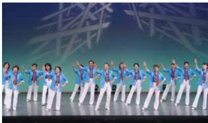
アミカ (手話ダンス) 時間 / 13:40~13:55

山崎メンズクラブは、山崎小学校に通う子供たちの父親とそのOBから成る、おやじの会です。毎年、山崎小学校では6年生になると、今も交流が続く山形県舟形小学校にヒントを得て創作した「山崎太鼓」を演奏しています。かけがえのないこの伝統芸能を守り育てようと、私たち大人も「山崎男太鼓」(やまざきメンたいこ)を創作・演奏、地域に貢献しています。