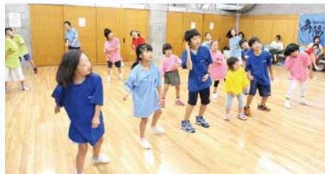
ダンスラボラトリー (ダンス) 時間 / 12:20~12:30

ダンスラボラトリーは世田谷区と川崎市で「障害があってもなくても皆で楽しくダンス」を合言葉に活動しています。この度、世田谷区との協働事業として区内の小中学生を対象に「ダンスやりたい小学生」を募集。8月より7回のダンス講座を開催して「ふれあいフェスタ」のステージに向けて練習してまいりました。15の小学校から集まったチーム「ドリームワールド」のダンスをお楽しみください。