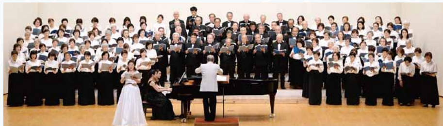
世田谷区民合唱団 (混声合唱) 時間 / 14:00~14:20

手話ダンスは歌詞と曲のイメージを簡単な手話とパフォーマンスで表現するダンスです。ボランティア活動を軸に皆でわきあいあいと楽しく踊っています。興味ある方のお立ち寄りお待ちしております。