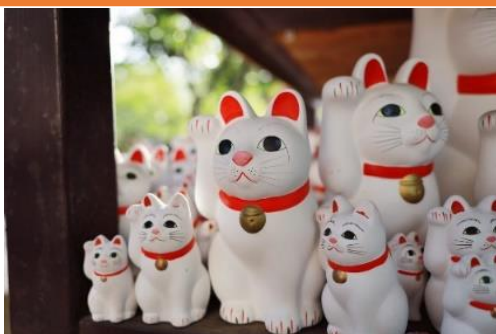
豪徳寺の招き猫たち