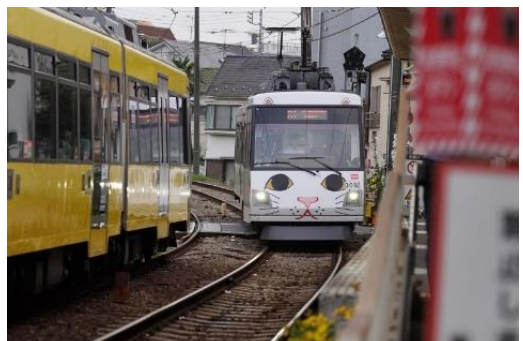
世田谷線のラッピング猫電車