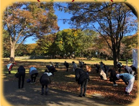
出発前に輪になって準備体操★