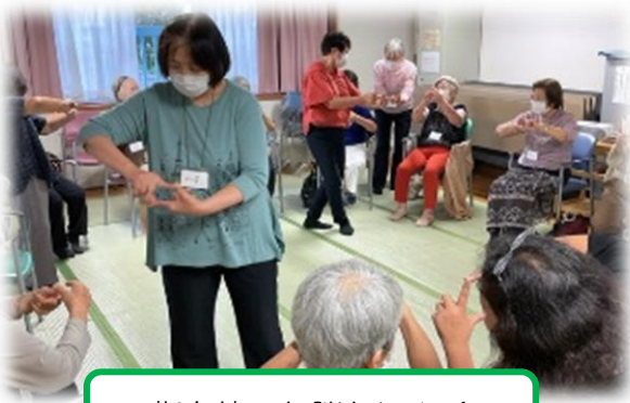
指を使った脳トレ☆彡