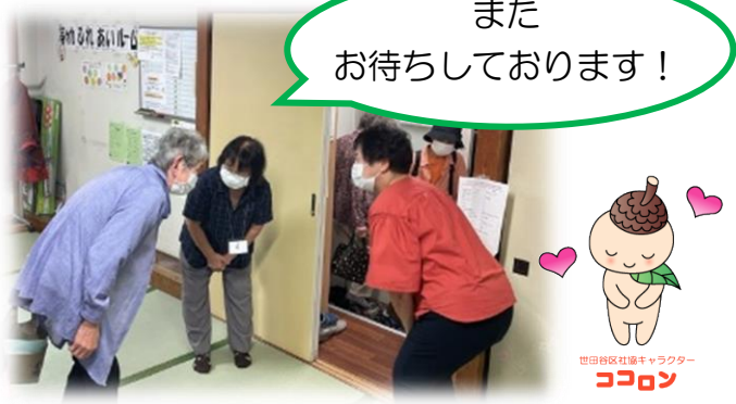
またお待ちしております！