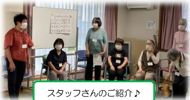
スタッフさんのご紹介♪