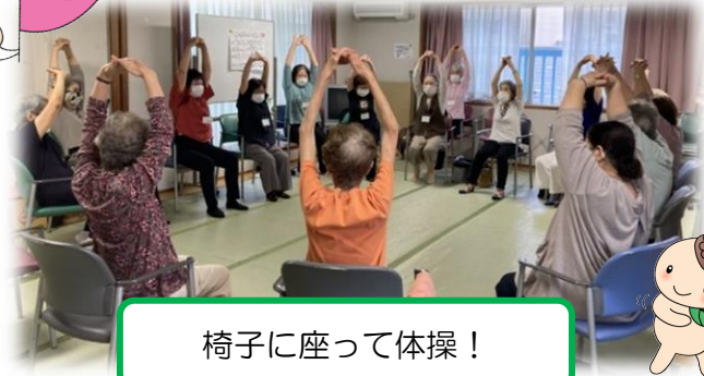
椅子に座って体操！