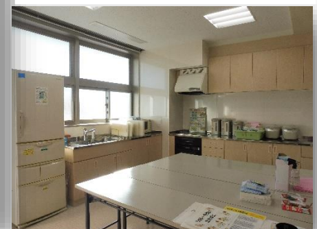
キッチン IH仕様です