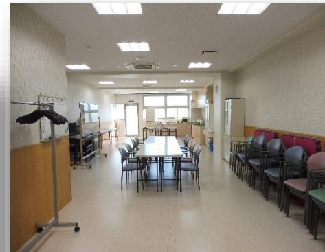
ふれあいルーム 部屋