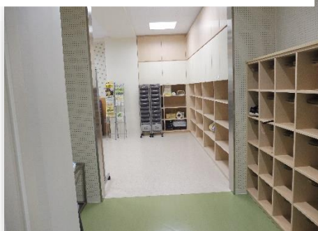
ふれあいルーム 入口