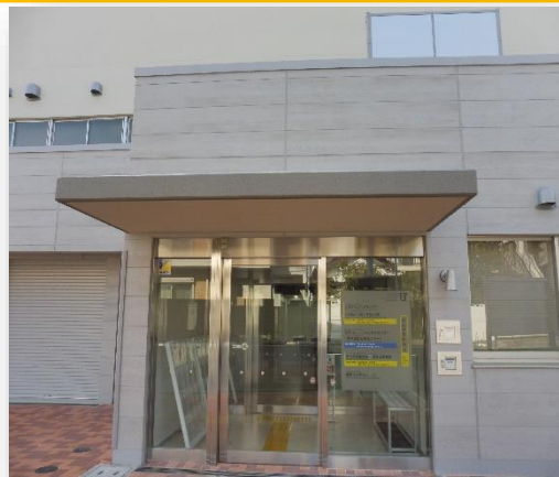
松原まちづくりセンター正面玄関 入口 B1階