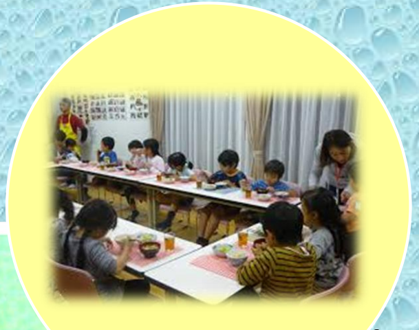
世田谷こども食堂・上馬 (上馬2-17-13)