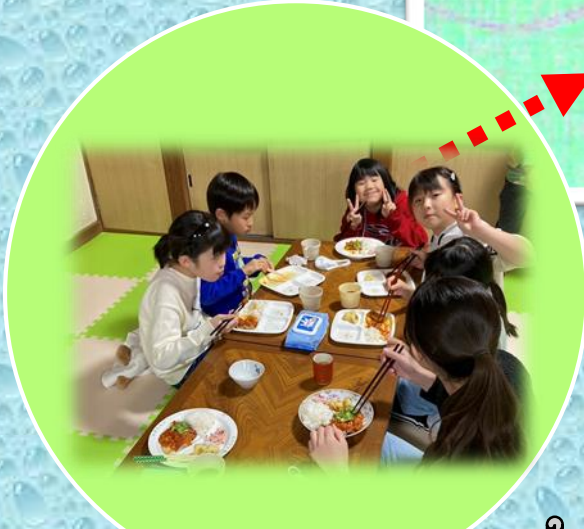
きしょうこども食堂 (駒沢1-15-8)