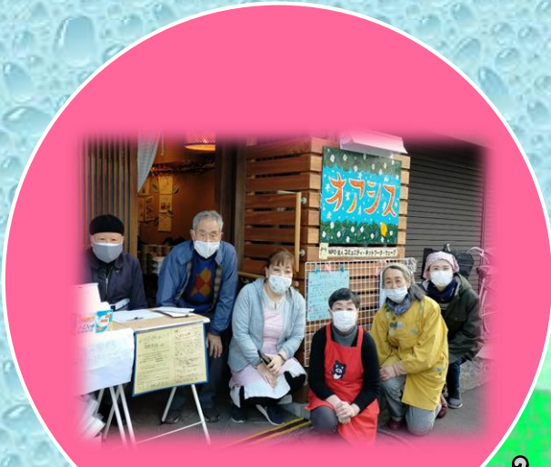
子ども食堂 ウェーブ (駒沢2-21-7)