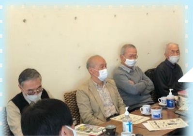
外国人のサポート