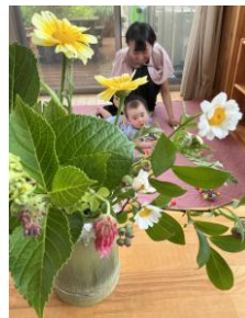
ママのアレンジメントと撮影