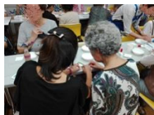
高齢者向けの交流イベントで一緒に手芸