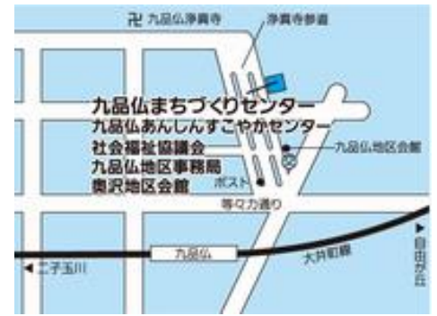
九品仏まちづくりセンター (九品仏7-35-4)