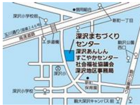
深沢まちづくりセンター (駒沢4-33-12)