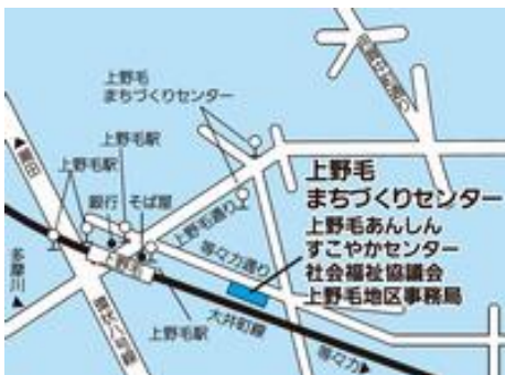
上野毛まちづくりセンター (中町2-33-11)