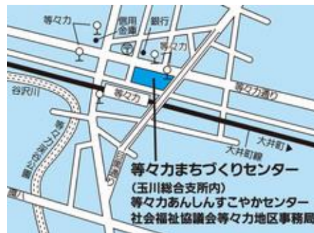
等々力まちづくりセンター (等々力3-4-1)