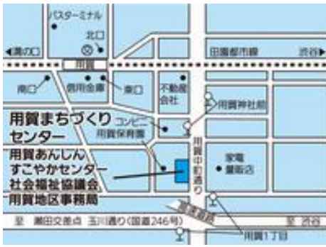
用賀まちづくりセンター (用賀2-29-22)