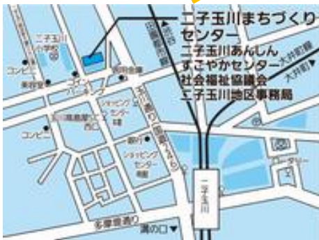
二子玉川まちづくりセンター (玉川4-4-5)