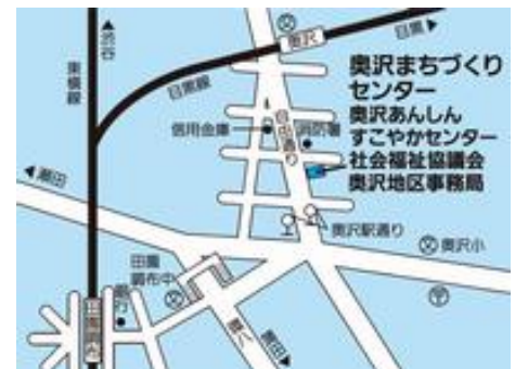
奥沢まちづくりセンター (奥沢3-15-7)