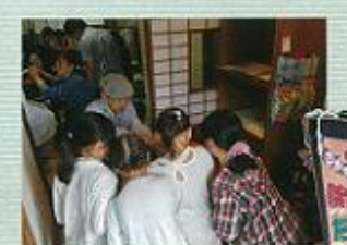
数珠子館に集る子どもたち (2014年)