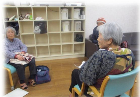
食後は皆でお話をして気分転換♪

★社協ではお買い物ツアーや移動販売会等の住民の声を聞く協議体を開催しております★