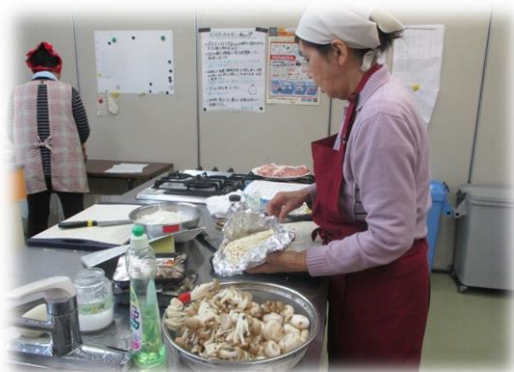
調理中は真剣そのもの！

今回はミニデイ 鎌土料理グループを紹介いたします。料理好きなメンバーで毎週土曜日に活動しています。第1・2・3土曜日は献立について話し合い、第4土曜日に料理を皆で作って、美味しく一緒に食べます。料理の後は体操やおしゃべりをして体も心もリフレッシュ。調理だけでなくメニューや材料を皆で考えて計画することで介護予防にもつながります。鎌土料理グループは鎌田食事サポートセンターだんなにて毎週土曜日10時~15時半に開催しています。是非、見学にいらして下さい♪