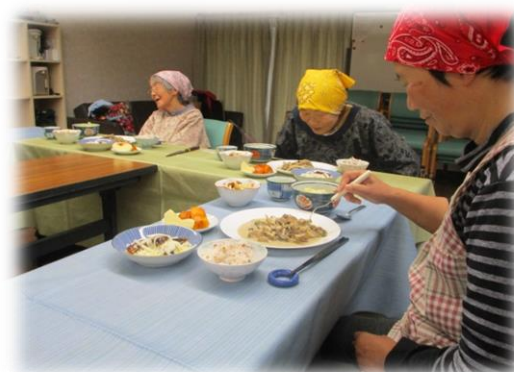
皆で作った料理の味もひとしお。