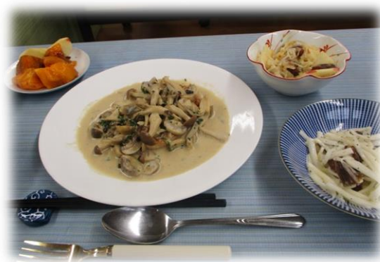
味付けだけでなく、見た目や彩りも大事。