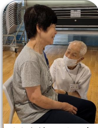
やわらぎマッサージ