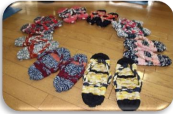
裂き布ぞうり作り

「なごみの広場ちとふな」は、高齢者の新たな居場所づくり事業です。健康運動室と視聴覚コーナーを会場に、暮らしに役立つ講座や趣味の講座を開催しています。ぜひご参加ください!