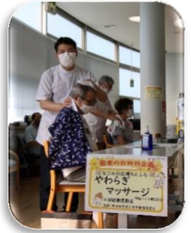
やわらぎマッサージ