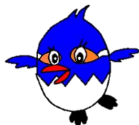
玉川総合支所 たませみ