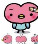
地域障害者相談支援センター ぽーとたまがわ 「ここみん」