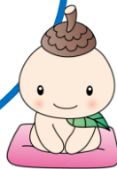
世田谷区社会福祉協議会 ココロ

奥沢地区で食品を必要とされる方に、奥沢地区の方から頂きました食品をお渡ししております。みなさまからの食品のご寄付をお願いいたします！！