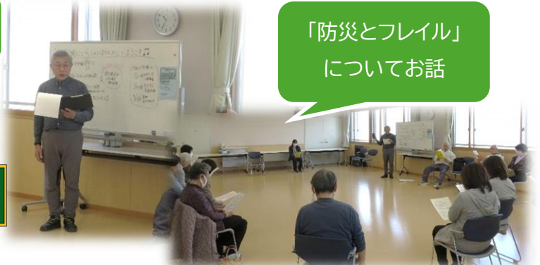
「防災とフレイル」 についてお話