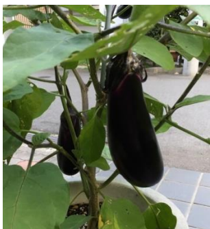
園芸部会の作った無農薬ナス