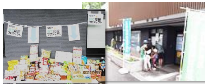
(前回の開催の様子)