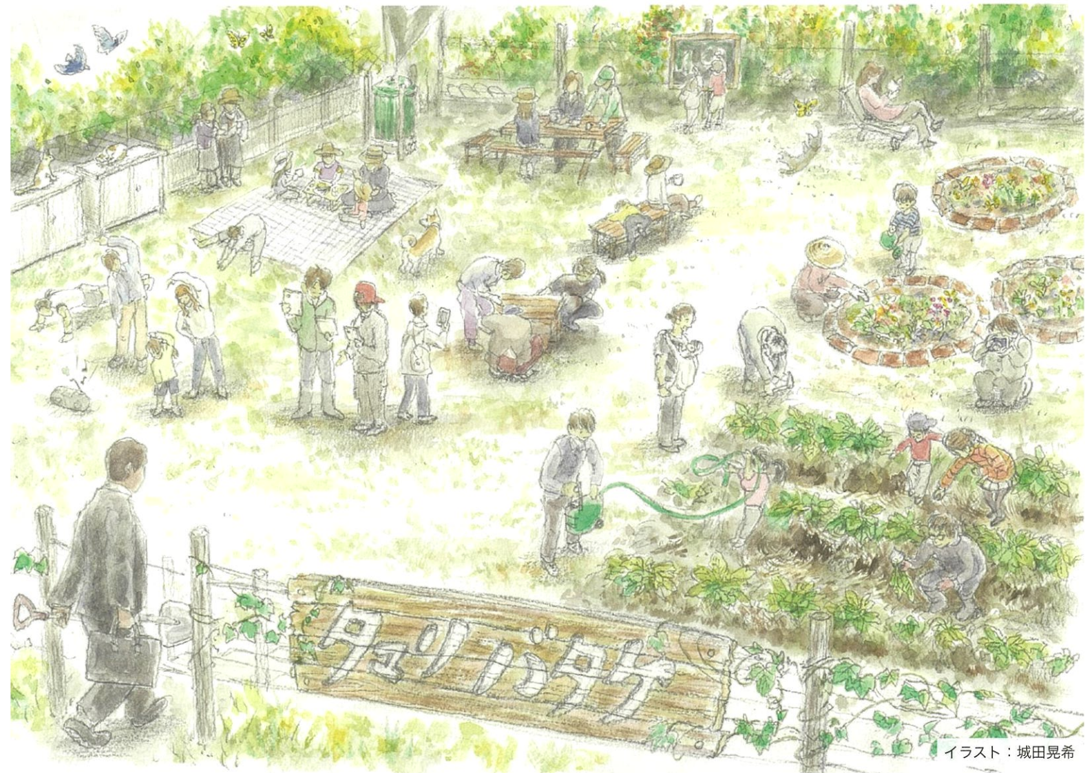
イラスト：城田晃希