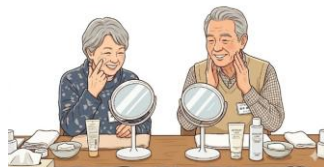
AIによるイメージ画像