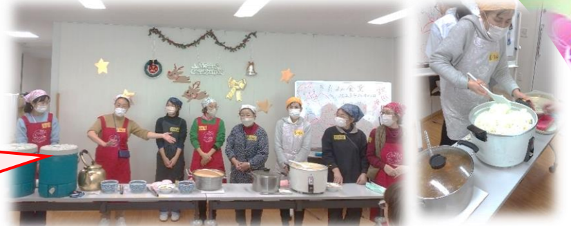
きたみ食堂のスタッフの皆さま

12月23日(土) @喜多見まちづくりセンター活動フロア コロナ禍で中止となっていた「じどうかん食堂」が、名前と形を変え「きたみ食堂」として戻ってきました！ じどうかん食堂のキッチンチームが担い手となり、久しぶりに再開されました。 2部に分けての開催でしたが、参加者25名ずつの予約がすぐに埋まり、当日は大盛況！ 地域の子供達、子育て世代、高齢者など多世代が集い、顔見知りになるきっかけが生まれる場になることを目指しています。 今後は年に4回ほどの開催予定です。機会がありましたら、是非、ご参加ください。