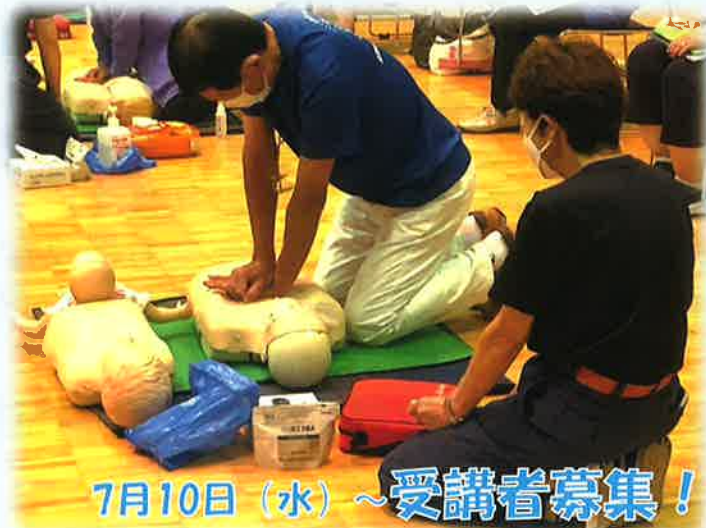
7月10日（水）～受講者募集！