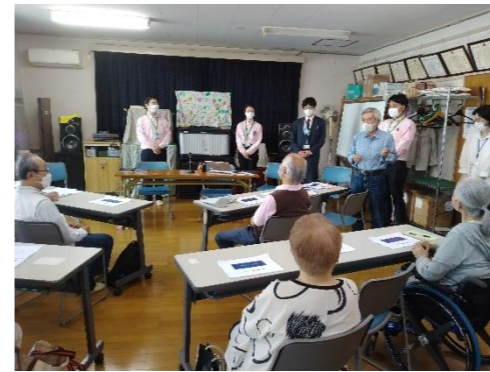
←大勢の方にご参加いただきました

高齢になってから、耳の聞こえが悪くなった方やご家族から指摘された方はいらっしゃいませんか？ 毎月第3木曜日の午後2時から喜多見2丁目団地集会所で開催している「だんだんの会」で、耳のお話をさせていただきました。 (協力：パナソニックエイジフリーショップ世田谷・パナソニック補聴器株式会社)