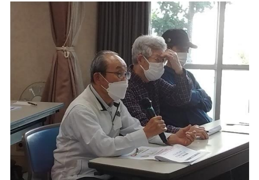
聞こえに関する心配事を質問→疑念で解決

当日は補聴器を使用している方や家族から補聴器の使用を勧められている方のご参加もありました。