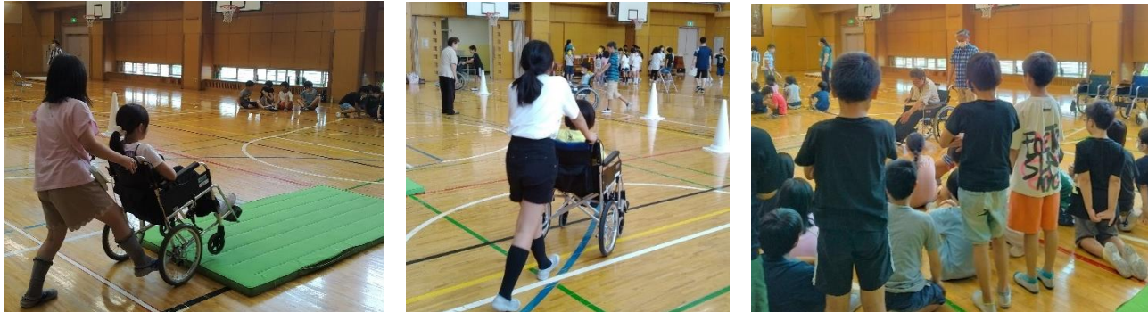
説明を聞きながら、やる気に満ちた背中

また、車椅子体験では、「車椅子で段差を上るのは難しい」「座っている時に斜めになるとこわい」など体感できたようです。皆さんは説明をよく聞いて、車椅子を安全に使うためのルールを意識して取り組みました。