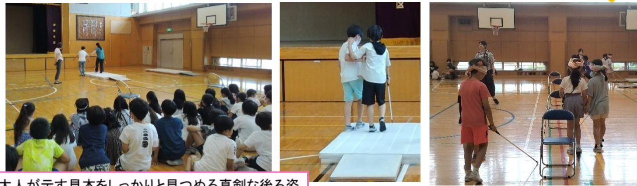
大人が示す見本をしっかりと見つめる真剣な後ろ姿

6月26日(月)、27日(火)鎌田にある砧南小学校で福祉学習をしました。4年生204人のお友達と先生方、ボランティアの6名と共に、活気ある授業となりました。アイマスクをして白杖をつき、お友達にガイドをしてもらう体験では、「方向感覚を失った」、「こわいなあと感じた」という感想が聞かれました。ガイド役は、声を掛け丁寧に誘導していました。