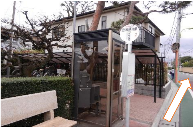
最寄りのバス停 関東バス「寺町通3番」